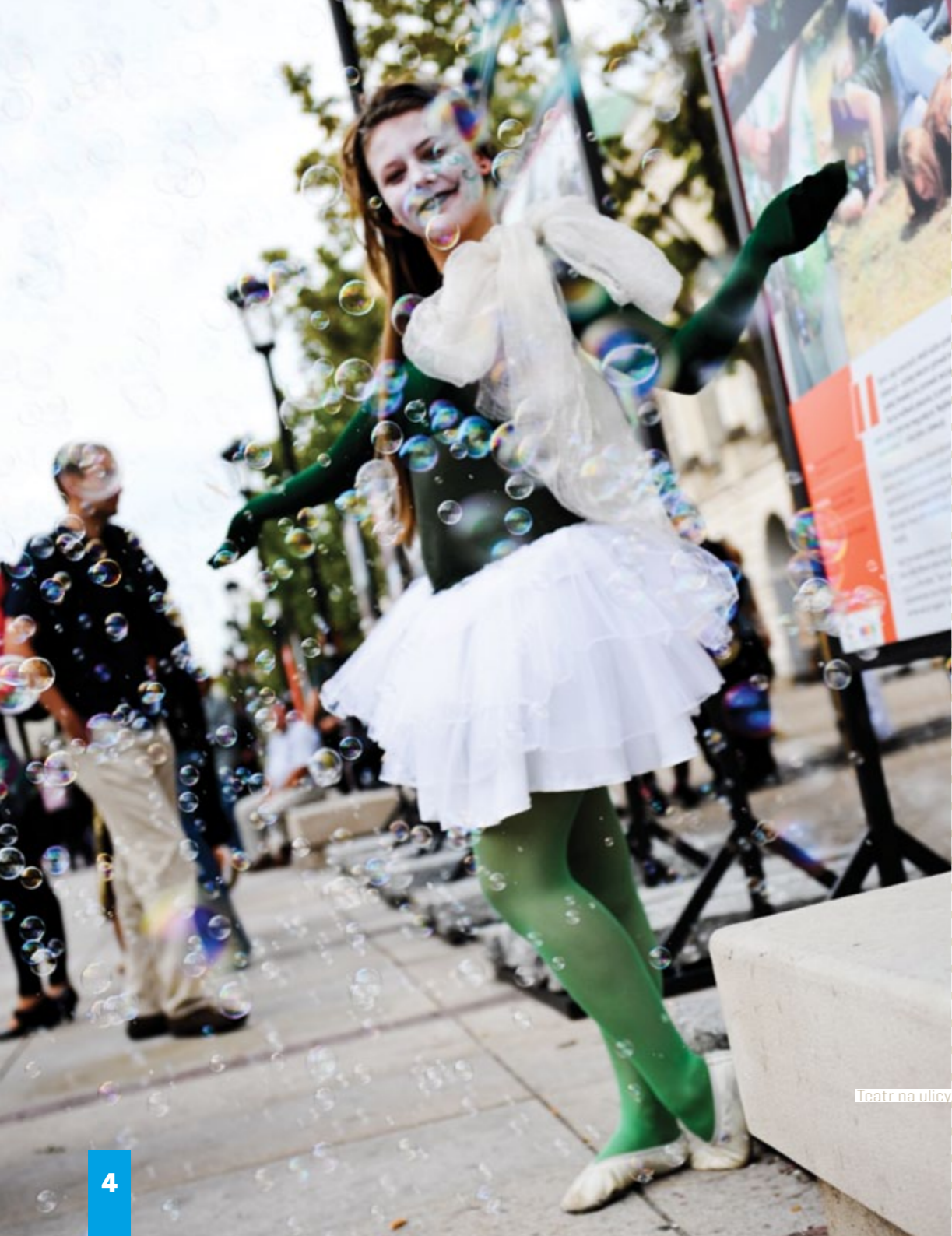
Teatr na ulicy