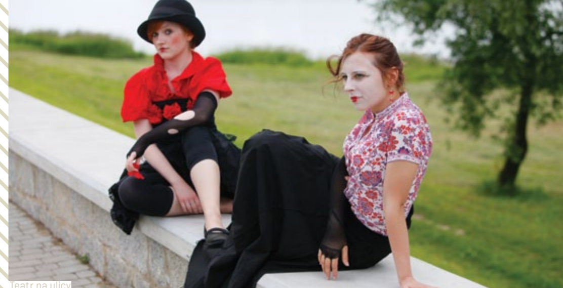
Teatr na ulicy