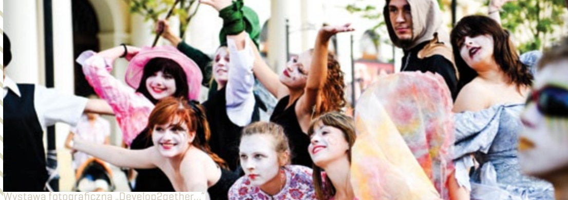
Wystawa fotograficzna „Develop2gether...”

Liczba dni zrealizowanych podczas projektów