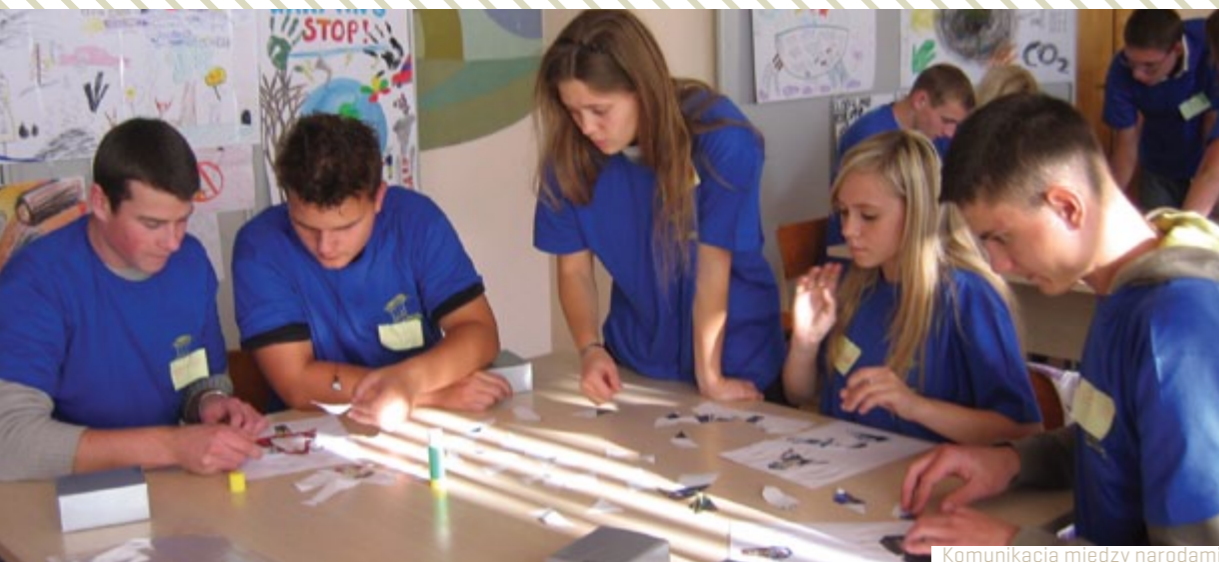
Komunikacja między narodami

przygotowywano się do finału wspólnego przedsięwzięcia, jakim był spektakl teatralny „Coś Ty uczynił ludziom, Mickiewiczu?”. Przy wsparciu aktorów częstochowskiego teatru młodzież przez kilka dni rozwijała swój kunszt aktorski i poszerzała horyzonty w wymienionym międzynarodowym gronie. Dzięki zajęciom, koncertom i warsztatom młodzi ludzie mogli pokazać innym, że pomimo edukacji na kierunkach technicznych, mają pasję artystyczną, którą od lat dzielnie pielęgnują. Finał projektu przyciągnął do Teatru im. Adama Mickiewicza całą salę gości. Każdy chciał zobaczyć, jak uczniowie szkoły technicznej wraz z kolegami i koleżankami z Litwy bawią się w aktorów. A trzeba przyznać, że bawili się znakomicie! Na scenie nie zabrakło humoru, ale były także powaga i nostalgia. Widzowie ze wzruszeniem wysłuchali polsko-litewskiej deklamacji utworu „Litwo, Ojczyzno moja...”, dając wyraz zachwytu aplauzem na stojąco.