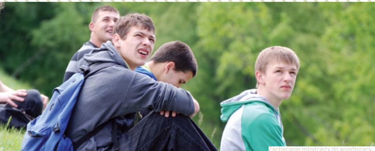
Zachęcanie młodzieży do współpracy...

Liczba projektów nadesłanych na konkurs wniosków