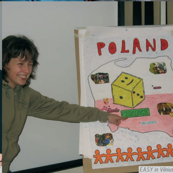
E.A.S.Y. in Vilnius