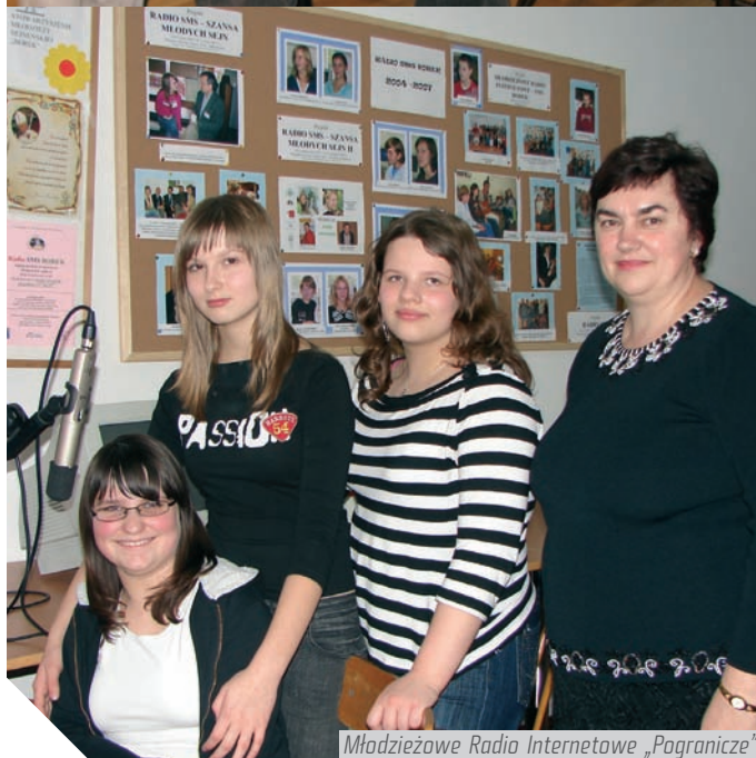
Młodzieżowe Radio Internetowe „Pogranicze”