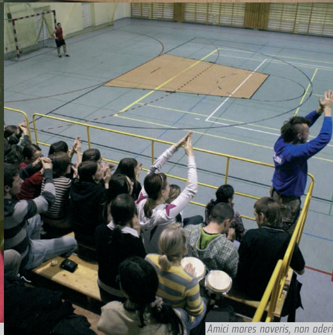
Amici mores noveris, non oderis