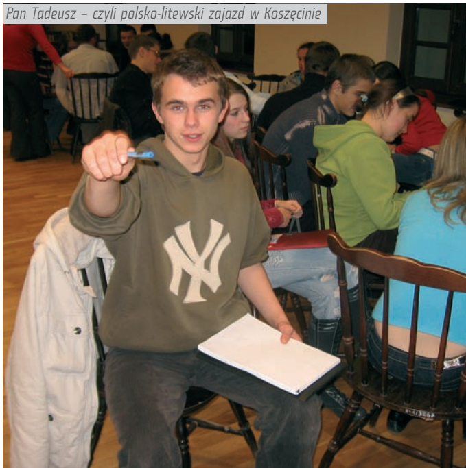
Pan Tadeusz – czyli polsko-litewski zajazd w Koszęcinie