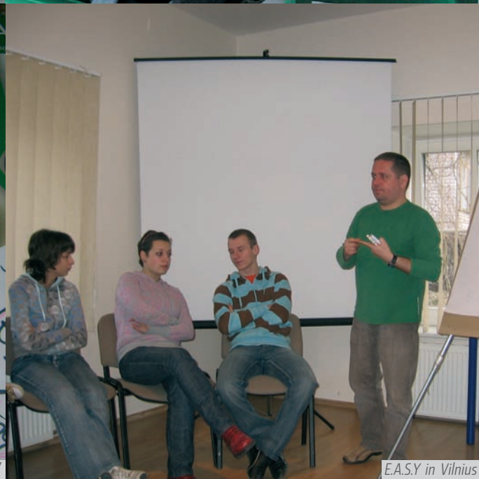
Młodzieżowe Radio Internetowe „Pogranicze”