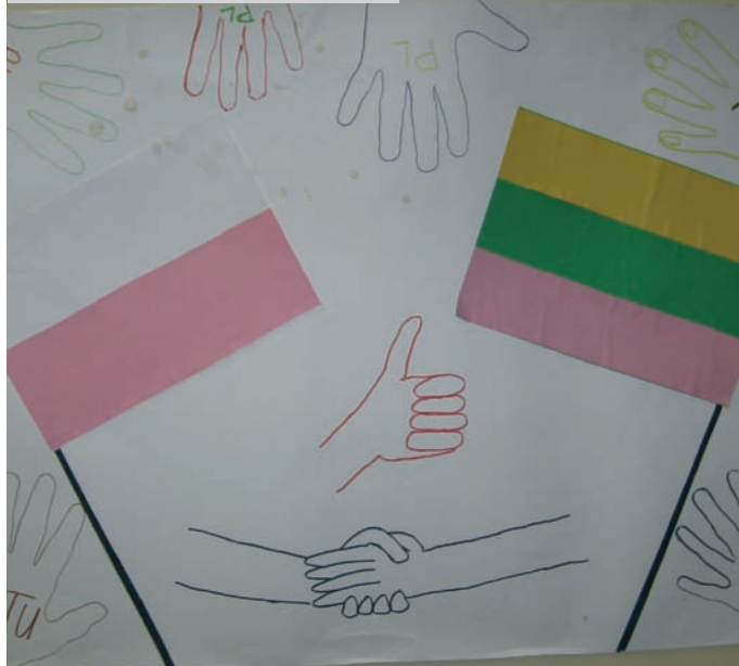
Młodzi Europejczycy głoszą na Tolerancję!