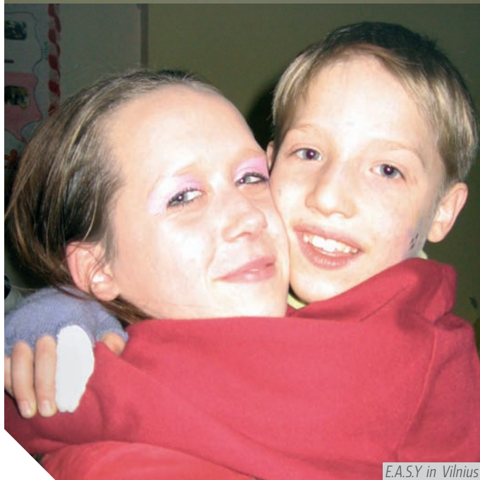
E.A.S.Y in Vilnius