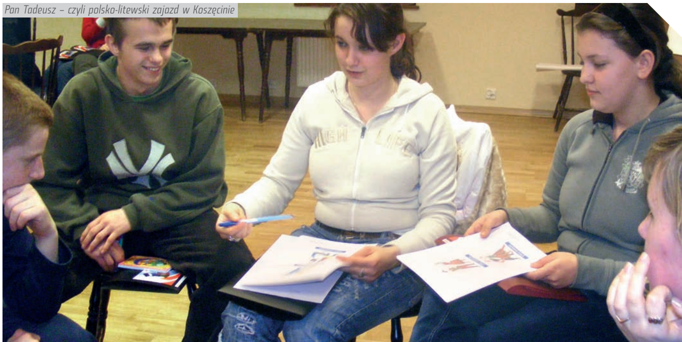
Pan Tadeusz – czyli polsko-litewski zajazd w Koszęcinie